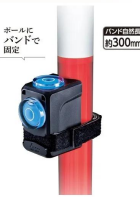
画像は、パイプへの取付イメージです。