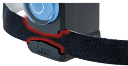
画像は、イメージです。