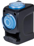
画像は、ロゴ付きの商品イメージです。