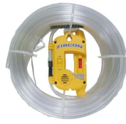
画像は、ロゴ付きの商品イメージです。