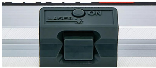
接触センサー (底部)