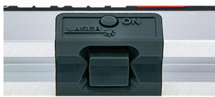
接触センサー(底部)