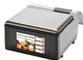
・7インチ仕様 解像度：800×480 WVGA