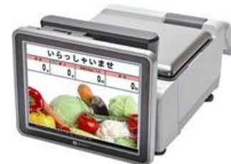
・12.1インチ仕様 解像度：800×600 SVGA