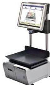
■セルフカメラタイプ