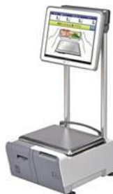
■セルフポールタイプ