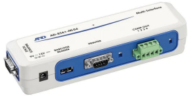
株式会社エー・アンド・デイ 画像は、商品イメージです。