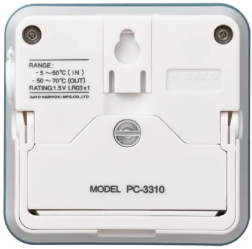
画像は、商品背面のイメージです。