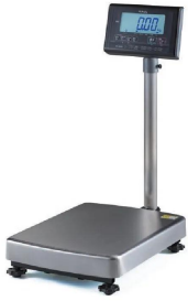
写真は、シリーズ代表画像です。：K L-S D 2-K 6 0 A