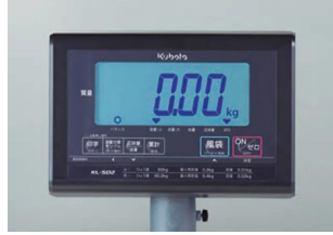
株式会社クボタ計装 株式会社クボタ (国産計装事業ユニット) 画像は、表示部のイメージです。