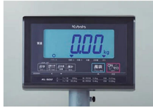
株式会社クボタ計装 株式会社クボタ (国産計装事業ユニット) 画像は、表示部のイメージです。