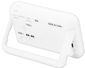
株式会社 エー・アンド・デイ