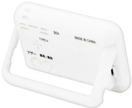
株式会社 エー・アンド・デイ