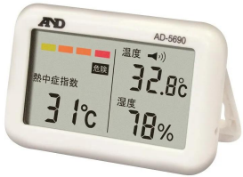
株式会社 エー・アンド・デイ