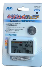
株式会社 エー・アンド・デイ