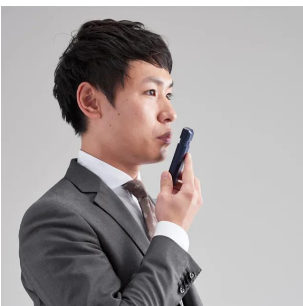
使用イメージです。