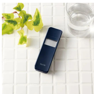
商品イメージです。