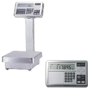
写真は、シリーズ代表画像です。表示器 i 0 2 のイメージは右下です。