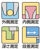
外側測定 内側測定 深さ測定 段差測定