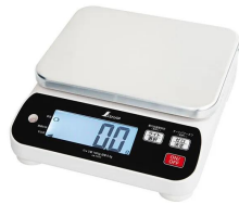
シンワ 測定株式会社 画像は、商品イメージです。