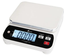
シンワ測定株式会社 画像は、商品イメージです。