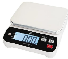
シンプ 測定株式会社 画像は、商品イメージです。