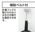
補助ベルト付 計量フックに 掛けられない 大きさの物で も測定できま す。