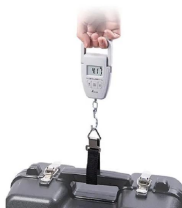
画像は、使用イメージです。 シンワ 測定株式会社