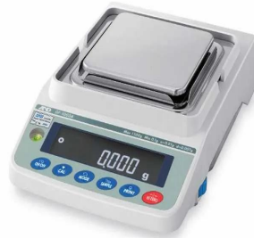
風防を取り外したイメージです。