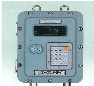
写真は、表示部のイメージです。