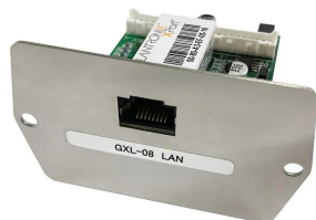
株式会社 エー・アンド・デイ