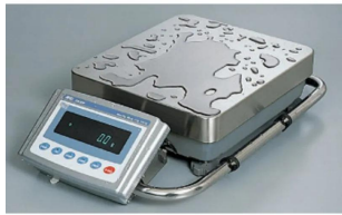
写真は、水滴が付く環境イメージです