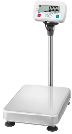
写真は、商品イメージです。