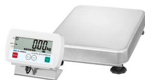
写真は、商品イメージです。