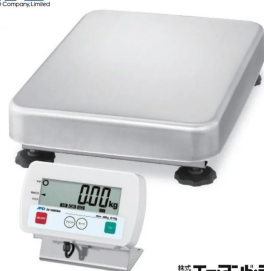
写真は、商品イメージです。