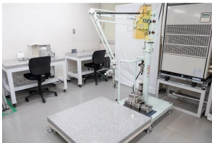
株式会社 エー・アンド・デイ