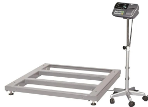
写真は、商品イメージです。