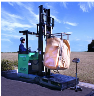
画像は、計量作業のイメージです。