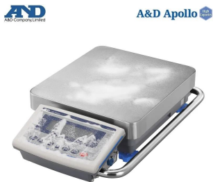
画像は、粉塵環境のイメージです。

生産ラインの組み込み時に I S D : 衝撃検出機能 繰り返し性・最小計量値の確認に E C L : 電子制御荷重機能 ポンプ流量など液体の計量に F R D : 流量測定機能 洗える安心：防塵・防水等級 I P 6 5 天びんの特性・計量スピードをチューニング可能 2ch出力標準装備：R S - 2 3 2 C と U S B