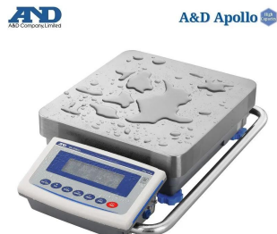
画像は、水濡れ環境のイメージです。