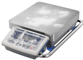
画像は、粉塵環境のイメージです。