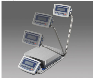
画像は、スイングアームのイメージです。