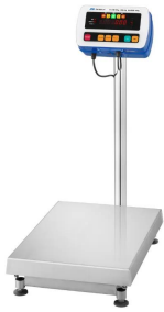
写真はイメージです