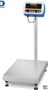
写真は、シリーズ代表画像です。