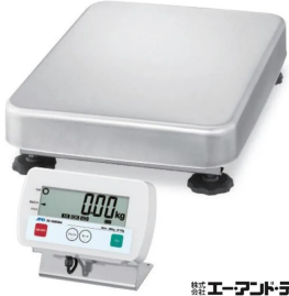
株式会社 エー・アンド・デイ