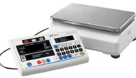
株式会社エー・アンド・デイ 画像は、表示部分離のイメージです。