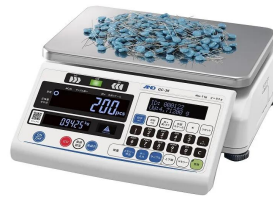
株式会社エー・アンド・デイ 画像は、係数作業のイメージです。