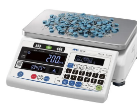
画像は、係数作業のイメージです。