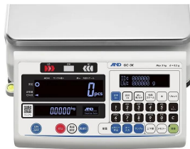
画像は、表示部のイメージです。