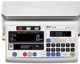
株式会社エー・アンド・デイ 画像は、表示部のイメージです。