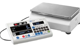
画像は、表示部分離のイメージです。