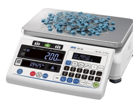
株式会社エー・アンド・デイ 画像は、係数作業のイメージです。