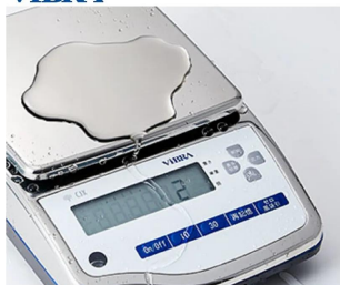
画像は、水濡れのイメージです。：C J X 6 2 0 0