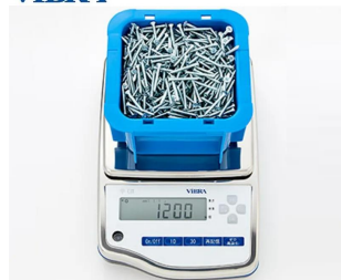
画像は、計数作業のイメージです。：C J X 6 2 0 0