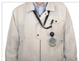
画像は、付属のネックストラップで首から下げ、胸ポケットに取り付けたイメージです。