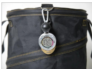
画像は、付属のカラビナで取り付けたイメージです。