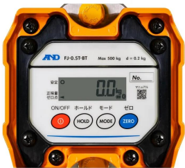
株式会社 エー・アンド・デイ 画像は、本体表示部のイメージです。