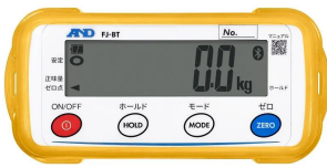
株式会社 エー・アンド・デイ 画像は、外部表示機のイメージです。