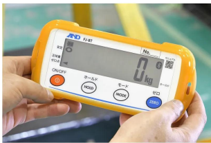
株式会社 エー・アンド・デイ 画像は、外部表示機の手持ちイメージです。