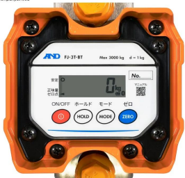
画像は、本体表示部のイメージです。