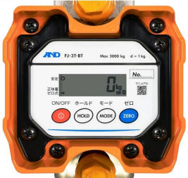
画像は、本体表示部のイメージです。