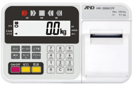
株式会社 エー・アンド・デイ 画像は、表示部のイメージです。