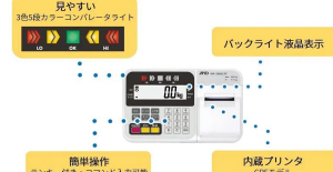
株式会社 エー・アンド・デイ 画像は、表示部のイメージです。