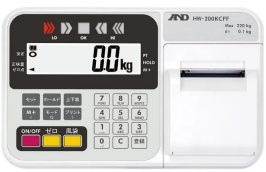
株式会社 エー・アンド・デイ 画像は、表示部のイメージです。