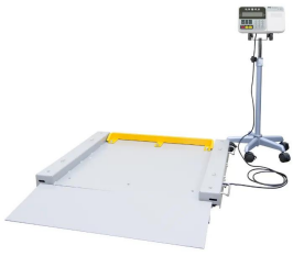
画像は、商品イメージです。ストップパは別売品です。