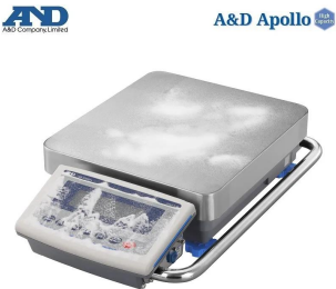
画像は、粉塵環境のイメージです。