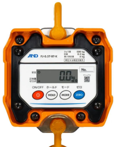
画像は、本体表示部のイメージです。