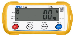
画像は、外部表示機のイメージです。