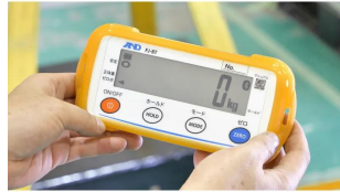
画像は、外部表示機の手持ちイメージです。