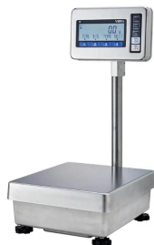
写真は、シリーズ代表画像です。