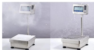
IP65規格適合の防塵・防水構造 ・IP65の防塵・防水性能を備え、水洗いも可能なステンレスボディ。 ・食品加工や化学薬品を取り扱う現場など、湿気や粉塵が多い場所でも安心してご使用いただけます。