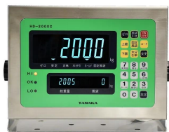
画像は、表示部のイメージです。