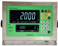
画像は、表示部のイメージです。

標準指示計HD-2000Cや他の指示計との接続も可能で自動計量に対応したシステムへの拡張も可能です。