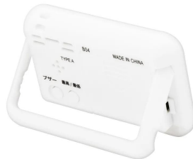
株式会社 エー・アンド・デイ