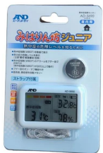
株式会社 エー・アンド・デイ