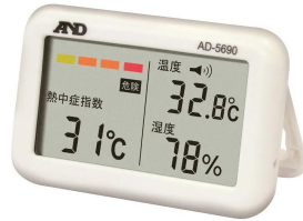
株式会社 エー・アンド・デイ