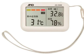
株式会社 エー・アンド・デイ