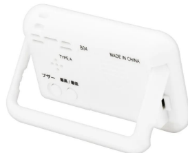
株式会社 エー・アンド・デイ