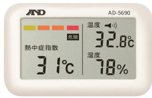
株式会社 エー・アンド・デイ