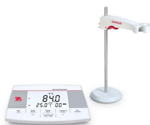
画像は、商品イメージです。