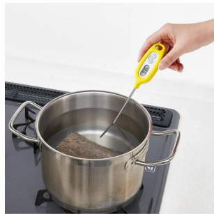
画像は使用イメージです