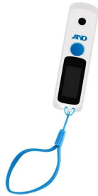
画像はストラップ装着時のイメージです