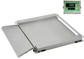
写真は、オプションのスロープ(別売)とストップパ(別売)をつけたイメージです。