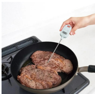
写真は使用イメージです