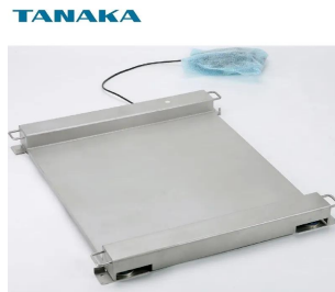
株式会社田中衡機工業所